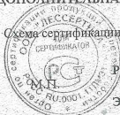
Схема сертификации – 3с по ГОСТ Р 53603-2009.